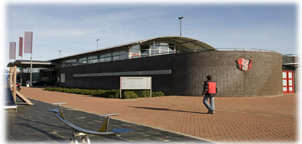
OJC Rosmalen, de locatie van de trainingen

Behalve professionele ondersteuning organiseren we ontspannende (en leerzame) activiteiten. Denk hierbij aan prominente gastsprekers, spelregels en voetbalquiz, een BBQ, wedstrijdbezoeken aan een BVO team, de jaarlijkse fietstocht, en meer. We hebben ook een voetbalteam dat elk jaar meedoet aan verschillende zaal- en veldvoetbal wedstrijden in de regio.