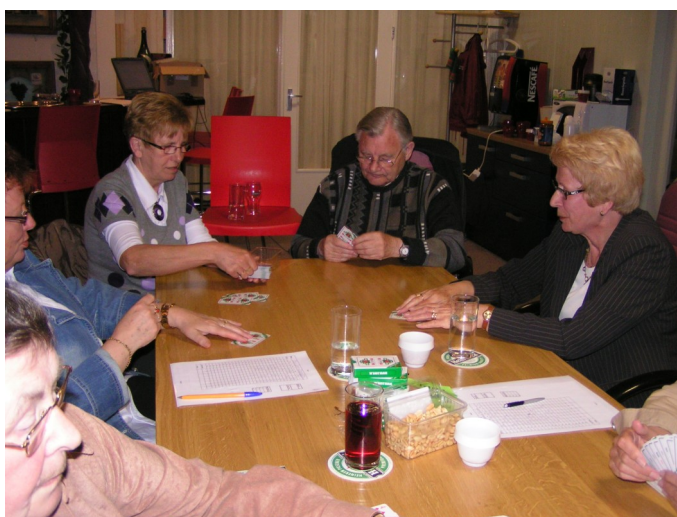
Kaartavond in de Eurohut in 2009

We hopen dat we je mogen begroeten op 24 mei om er samen een geslaagde avond van te maken.